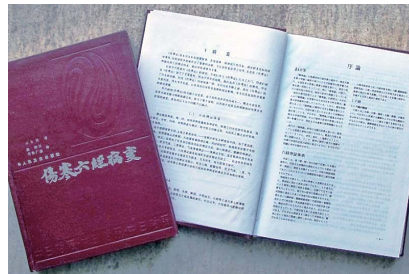
楊育周著，森雄材・安井廣迪共訳『傷寒六経病変』（人民衛生出版社）