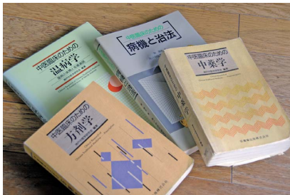
医歯薬出版から発行した『中医臨床のための病機と治法』『中医臨床のための中薬学』（現在は東洋学術出版社）『中医臨床のための方剂学』『中医臨床のための温病学』