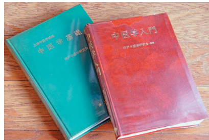
『中医学基礎』(燎原)と『中医学入門』(医歯薬出版)